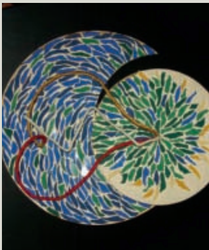
Ik geef je ruimte