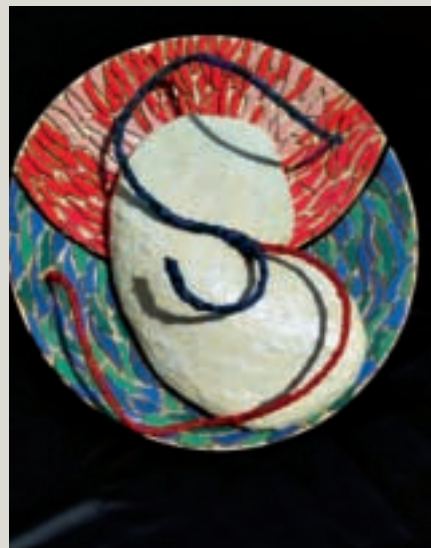
Ik geef je adem