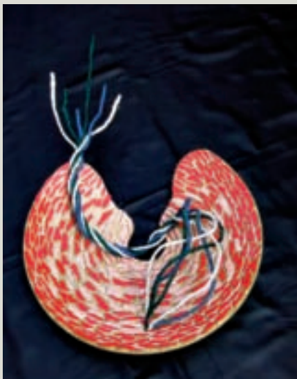
Bron van leven